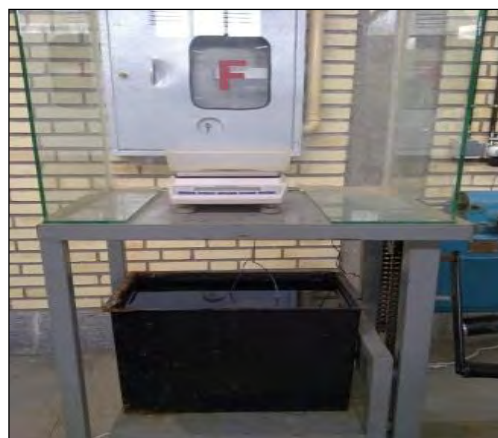
شکل ۸- ترازوی ارشمیدس

پس بدین صورت حجم فضای خالی (Vv) به دست خواهد آمد. به منظور تعیین حجم کل (V) نمونه مقدار جرم غوطه‌ور را از جرم اشباع کم می‌کنیم. با داشتن دو مقدار حجم فضای خالی و حجم کل و قرار دادن اعداد در فرمول تخلخل میزان تخلخل هر نمونه محاسبه می‌شود. لازم به ذکر است که برای تک‌تک نمونه‌ها میزان جرم خشک، جرم اشباع، جرم غوطه‌ور، حجم فضای خالی، حجم کل و در نهایت میزان تخلخل بر حسب درصد محاسبه گردیده است.