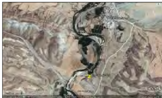
شکل ۳- موقعیت روستای چهل امیران و تپه قشلاق به نسبت شهر بیجار

به منظور تعیین تخلخل تعداد ۲۵ نمونه سفال برای انجام آزمایش انتخاب شدند (جدول ۴). ۹ نمونه مربوط به گروه پوشش غلیظ با توجه به اینکه از نظر ویژگی‌ها از تنوع بیشتری داشتند و بیشترین داده‌های سفالی محوطه در دوره مس‌سنگی (حدود ۷۹ درصد کل سفال) را دارا