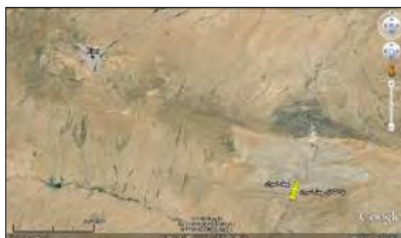
شکل ۴- جایگاه تپه قشلاق در جنوب روستای چهل امیران و موقعیت رودخانه تالوار در جانب غربی تپه