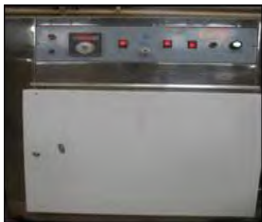
شکل ۶- کوره (گرمخانه)

وسایل مورد نیاز برای آزمایش: ۱- گرمخانه با قابلیت تولید و ثابت نگه داشتن درجه حرارت ۱۰۵ درجه سانتی‌گراد با دقتی معادل ۳ درجه ۲- ترازوی دیجیتال با دقت ۰/۱ گرم ۳- ترازوی ارشمیدس به منظور تعیین حجم نمونه با شکل هندسی نامنظم (فهیمی‌فرد و سروش، ۱۳۸۰: ۶۹)