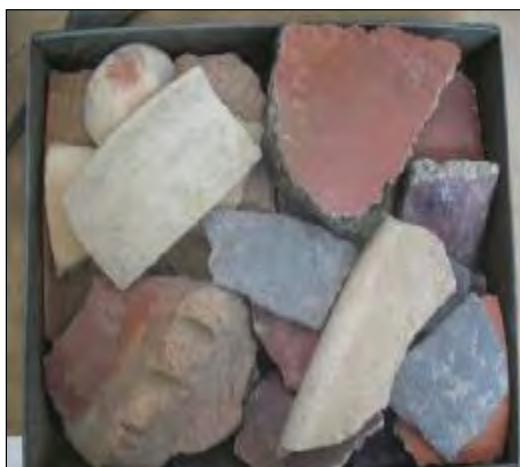
شکل ۵- گذاشتن سفال‌ها در ظرف فلزی به منظور قرار دادن در کوره