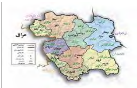
شکل ۲- نقشه استان کردستان