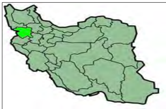
شکل ۱- نقشه موقعیت استان کردستان