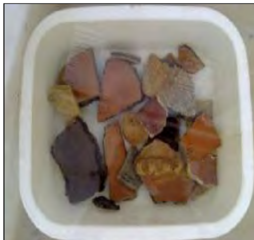
شکل ۷- گذاشتن سفال‌ها در آب به منظور اشباع

میانگین گروه نیم‌پوشش با میانگین گروه‌های پوک آشپزخانه‌ای و خاکستری اختلاف معنی‌داری ندارد